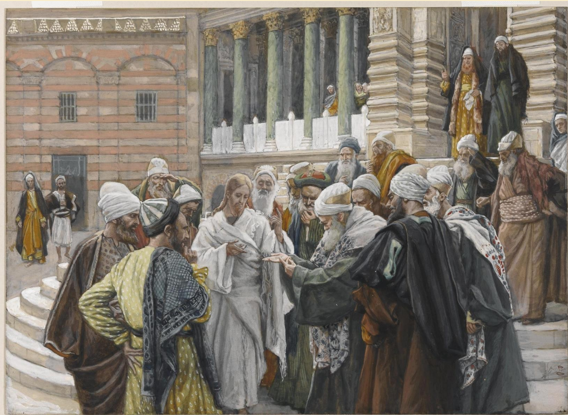
Tissot 1890 Le denier de César Brooklyn Museum