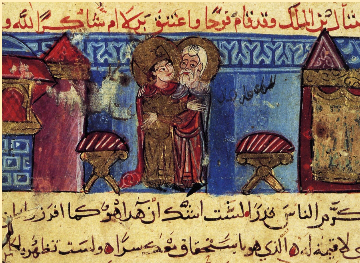
Liban Manuscrit XIIIème Notre-Dame de Balamand