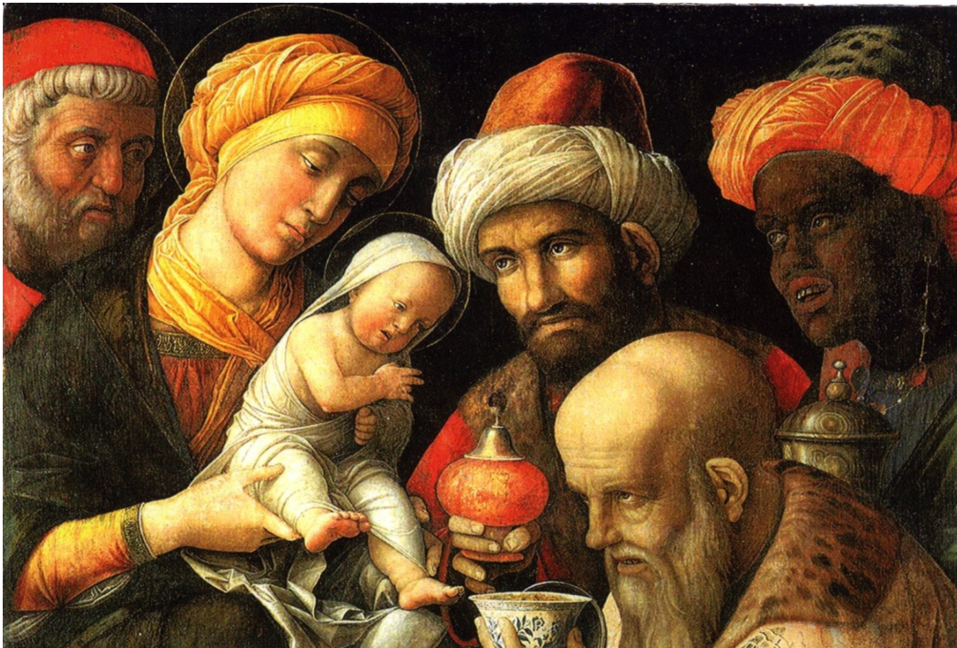
Andrea Mantegna Huile sur toile 1495 Musée Paul Getty

« Les mages, entrèrent dans la maison... se prosternèrent devant l'enfant »