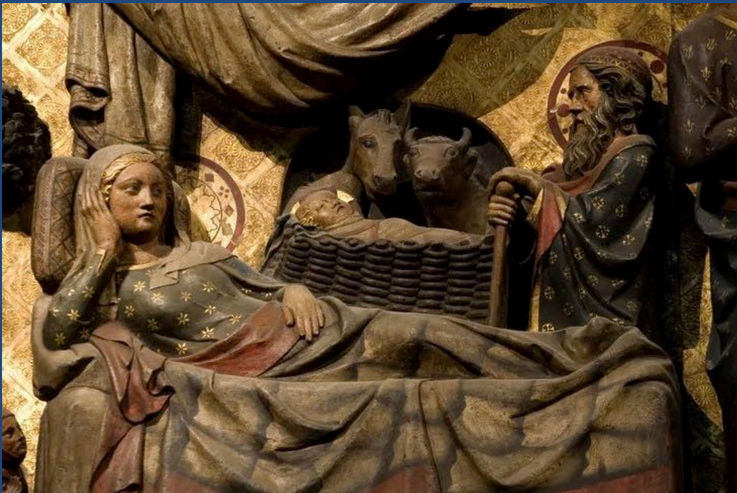
clôture du Chœur de Notre Dame de Paris (XIII°)