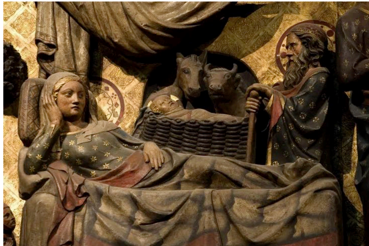
clôture du Chœur de Notre Dame de Paris (XIII°)

« Aujourd'hui, dans la ville de David, vous est né un Sauveur qui est le Christ, le Seigneur. Et voici le signe qui vous est donné : vous trouverez un nouveau-né emmailloté et couché dans une mangeoire. »